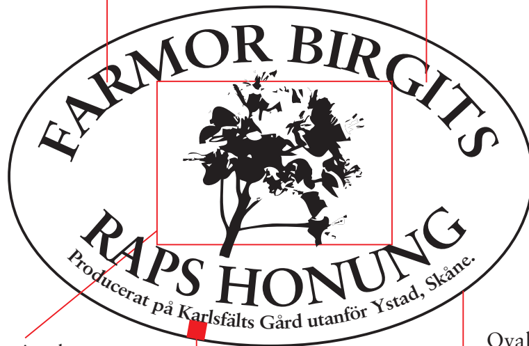
Illustration bör fylla 30*20 mm

Sättes i Sabon Bold 20p versaler. Spärra vid behov.